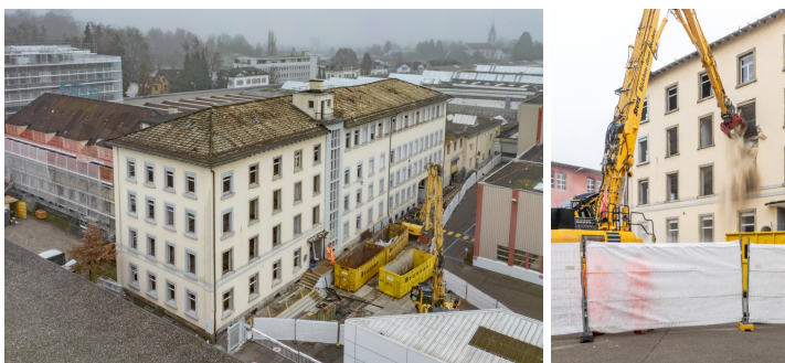
1) + 2) Aufnahmen Rückbau Bürogebäude 8003 / 4. Dezember 2025

Steht Ihnen unter folgendem Link zum Download bereit: https://www.swisstransfer.com/d/bb9693b1-4d75-4de8-ab54-dbe24261b6e8