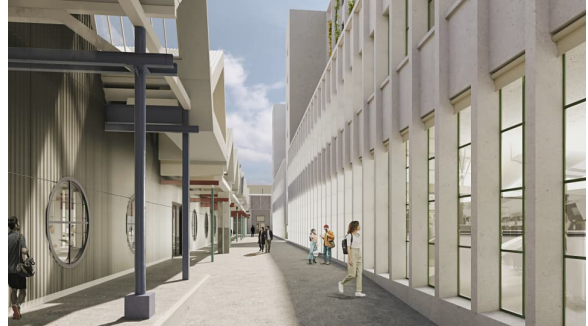
3) + 4) Visualisierungen mit «Shedhalle» (links) und dem Neubau für Industrie, Gewerbe und Parking (rechts).