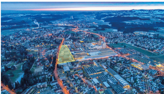
7) Situationsplan des Areals «Mahlwerk Uzwil»